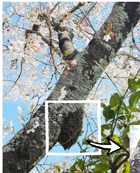
↑今年の4月上旬の写真